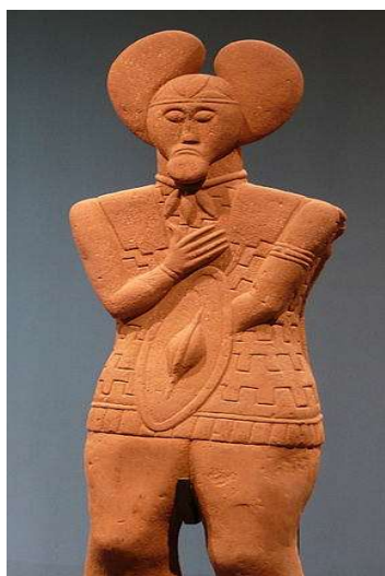
Prince de Glauberg (Allemagne) sculpture du milieu de 6ème siècle avant JC.

Je vous laisse partir à la découverte de cela, prenez le temps de le faire pour tenter de comprendre notre histoire et la culture européenne qui nous le verrons se confond souvent avec celle de notre région Bourgogne-Franche-Comté située à des carrefours géographique, économique, culturel et politique de notre histoire commune.